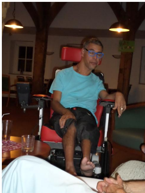
Met een drankje en een hapje was het zo weer laat geworden.